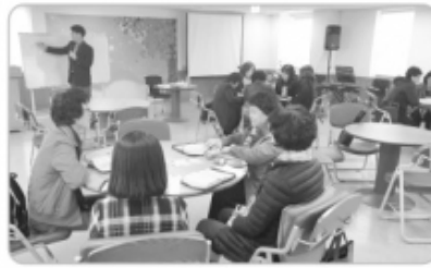
〈선한목자 행복플러스 개강〉