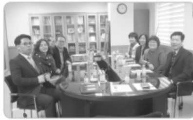
〈담임목사와 함께하는 행복플러스(행사위원회)〉