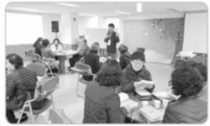
〈'영성의 깊은 샘' 개강〉